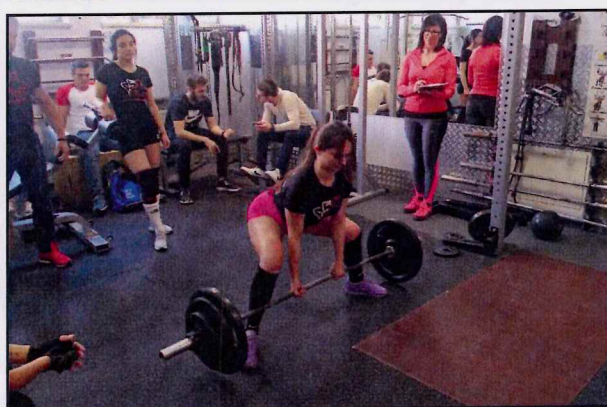
Po lewej: członkowie Stowarzyszenia SPORTATUT podczas organizowanych w 2018 roku Krobskich Zmagania Siłowych; po prawej u góry i na dole: trening krobskich trójboistów