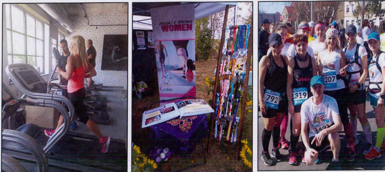
Po lewej: trening członkiń Stowarzyszenia „Biegaj z Krobią – WOMEN”; na środku: stoisko promocyjne Stowarzyszenia podczas VIII. Festiwalu Tradycji i Folkloru w Domachowie; po prawej: członkinie Stowarzyszenia jako uczestniczki 45. Maratonu Dębno; źródło: http://www.facebook.com/BiegajZKrobiaWOMEN