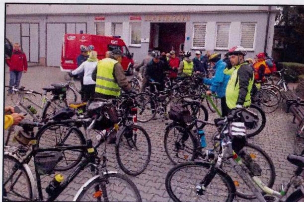
Po lewej: czterodniowy Rajd „Z wizytą u przyjaciół” (23-26.08.2018 roku); po prawej: przygotowania do Rajdu „Ku czci rozstrzelanych (21.10.2018 r.)