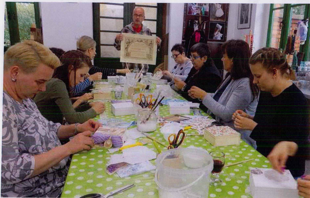
Zajęcia rękodzielnicze w Muzeum Stolarstwa i Biskupizny w Krobi