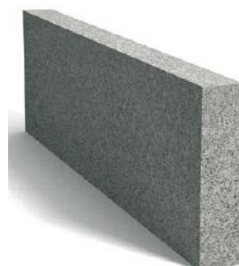
Tablica 1. Wymiary obrzeży.