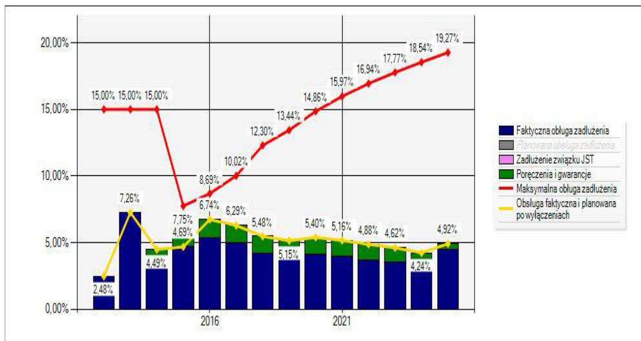
Wykres Nr 1.